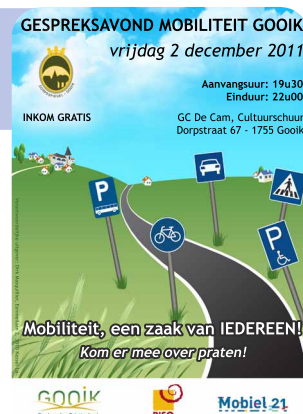
Figuur 15: Affiche als oproep voor bewonersvergadering in Gooik

Uitnodigingen voor een gespreksavond via de verspreiding van flyers, deur-aan-deur bij alle burgers van Gooik