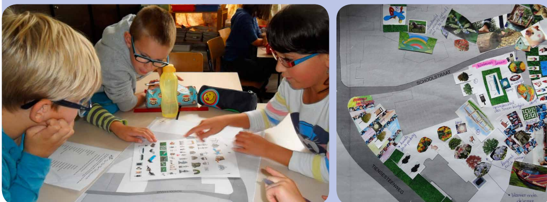
Figuur 14: Kinderparticipatie in Binkom

Het eindresultaat wordt door de leerlingenraad voorgesteld aan de burgemeester en de bevoegde schepenen, in aanwezigheid van de architect, projectontwikkelaar, andere belanghebbenden en de pers (Bijlage 2.17).