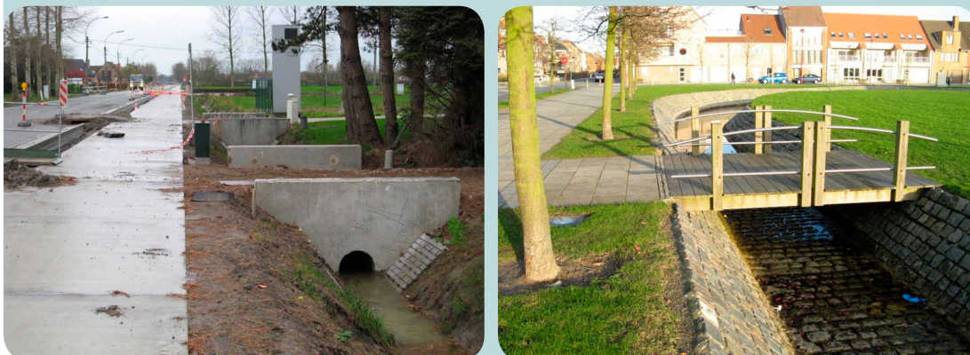
Figuur 13: Visualiseren in projectfase

Ook al zijn kandidaten voor een klankbordgroep meestal erg geëngageerd om het traject af te leggen, toch moet veel 'techniciteit' vermeden worden. Visualisaties helpen hierbij.